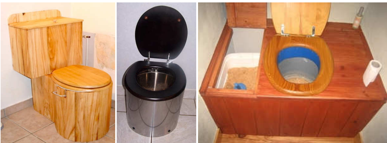
Fig. 1. Exemples des TLB des familles Potier, Mechin et Tatard. 1

Ce type de toilette, développé dans les années 1990, se présente comme une caisse, contenant un récipient (par exemple un seau en acier inoxydable), dont la planche supérieure basculante est percée d'une ouverture sur laquelle on a fixé une lunette de W-C classique. L'aspect extérieur varie en fonction des goûts de chacun.